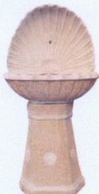
Ref. 66 L 65 x A 130