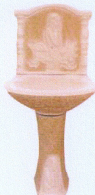
Ref. 67 L 64 x A 130