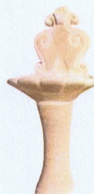
Ref. 68 L 60 x A 125