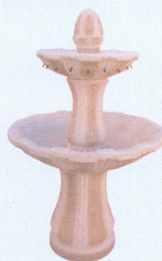
Ref. 106A L 84 x A 140