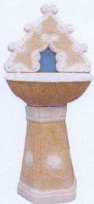
Ref. 65 L 65 x A 130