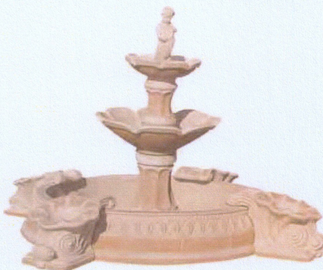
Ref. 82 L 220 x A 145