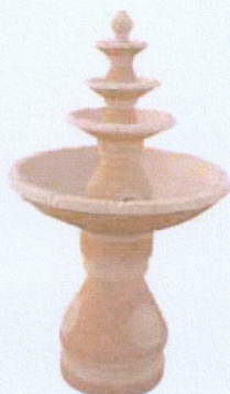
Ref. 89 L 84 x A 143