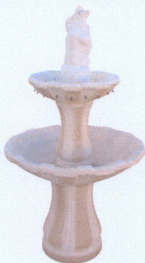
Ref. 106 L 84 x A 150