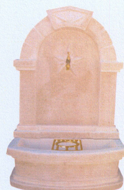
Ref. 97 B 70 x L 45 x A 107