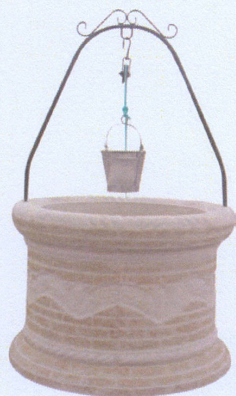
Ref. 91 L 107 x A 70 Altura com aro 168