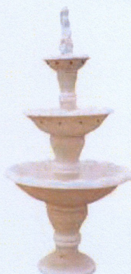
Ref. 88 L 85 x A 165