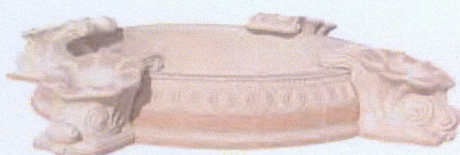
Ref. 83 - Lago e Botas: L 220 x A 30 Ref. 83A - Só Lago: L 140 x A 30