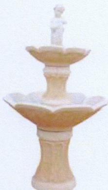
Ref. 80 L 85 x A 140