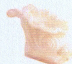
Ref. 84 L 40 x A 30