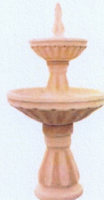
Ref. 86 L 96 x A 180