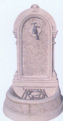
Ref. 96 B 44 x L 52 x A 82