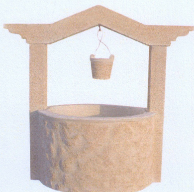
Ref. 93 L 100 x A 90 Só o poço: L 63 x A 38