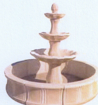
Ref. 98 L 215 x A 180