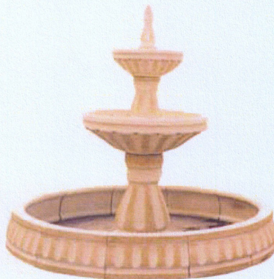
Ref. 85 L 210 x A 180