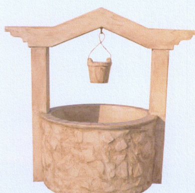
Ref. 94 L 100 x A 90 Só o poço: L 63 x A 38

A - Altura; B - Base; C - Comprimento; L - Largura; - Medidas em centímetros