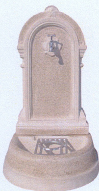
Ref. 95 B 44 x L 52 x A 82