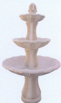
Ref. 99 L 107 x A 180